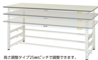
高さ調整タイプ25mmピッチで調整できます。